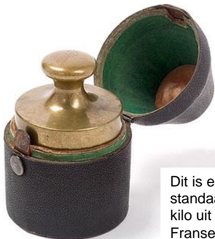
Dit is een standaard kilo uit de Franse tijd.

In ons land werden ook allemaal verschillende maten en gewichten gebruikt. Elke provincie en soms ook elke stad had andere maten en gewichten. De lengtematen waren vaak afgeleid van lichaamsdelen: de voet, de el, de duim. Het onhandige hieraan was dat de lengte daarvan overal verschillend was. De Rijnlandse voet had bijvoorbeeld een andere lengte dan de Utrechtse voet. Ook de gewichten en de inhoudsmaten waren overal verschillend. Dat was vreselijk onhandig bij het zaken doen. Stel je voor dat een pond op de ene plaats 494 gram is, en op de andere plaats 469. Dit betekent dat iedere handelaar altijd zijn eigen weegschaal en gewichten moet meenemen en dat als er iets verkocht wordt, men alles altijd moet wegen en omrekenen. Napoleon voerde standaardmaten en gewichten in: de liter, de meter en de kilo. Heel handig hieraan is dat het een decimaal stelsel is. Dat betekent: tientalig (van het Latijnse woord decimus dat tiende betekent). Je kunt liter, meter en kilo steeds door 10 delen of ermee vermenigvuldigen, en dan krijg je andere, ook erkende maten.