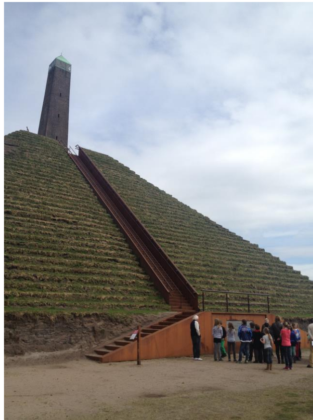
De Pyramide van Austerlitz