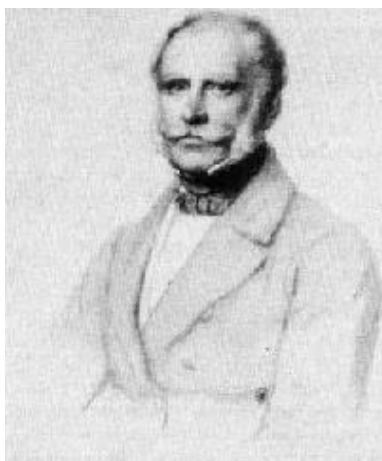
Dit is generaal Dumonceau op latere leeftijd.