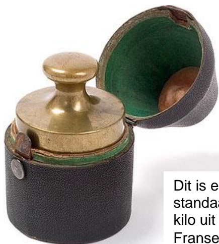
Dit is een standaard kilo uit de Franse tijd.

In ons land werden ook allemaal verschillende maten en gewichten gebruikt. Elke provincie en soms ook elke stad had andere maten en gewichten. De lengtematen waren vaak afgeleid van lichaamsdelen: de voet, de el, de duim. Het onhandige hieraan was dat de lengte daarvan overal verschillend was. De Rijnlandse voet had bijvoorbeeld een andere lengte dan de Utrechtse voet. Ook de gewichten en de inhoudsmaten waren overal verschillend. Dat was vreselijk onhandig bij het zaken doen. Stel je voor dat een pond op de ene plaats 494 gram is, en op de andere plaats 469. Dit betekent dat iedere handelaar altijd zijn eigen weegschaal en gewichten moet meenemen en dat als er iets verkocht wordt, men alles altijd moet wegen en omrekenen. Napoleon voerde standaardmaten en gewichten in: de liter, de meter en de kilo. Heel handig hieraan is dat het een decimaal stelsel is. Dat betekent: tientalig (van het Latijnse woord decimus dat tiende betekent). Je kunt liter, meter en kilo steeds door 10 delen of ermee vermenigvuldigen, en dan krijg je andere, ook erkende maten.