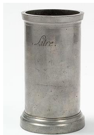
Dit is een standaard liter uit de Franse tijd.