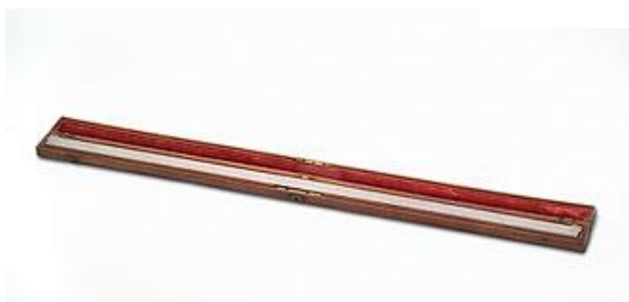
Dit is een standaard meter uit de Franse tijd.